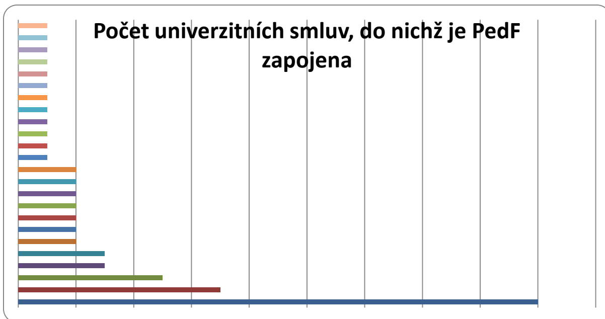
Obrázek IV-1 Počet univerzitních smluv pro 2015